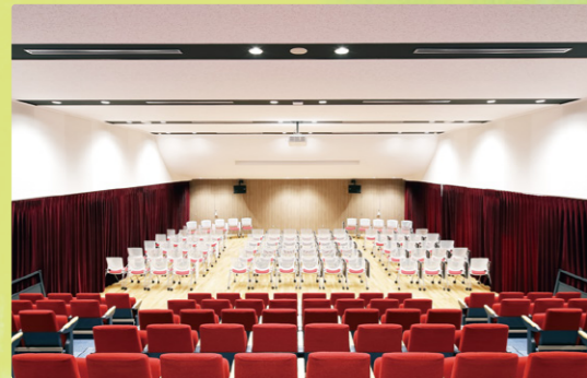
音楽ホール/新3号館

生徒たちがのびのびと学習や運動に取り組むための環境を整え、 安心・快適な学校生活をサポートします。