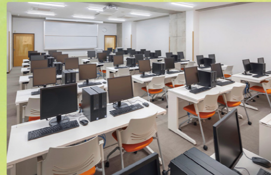
パソコン室/新3号館

音響設備を完備し、演奏会や楽器の練習には最適の環境が整っています。ここでは演奏会だけでなく、講演会や式典も実施します。